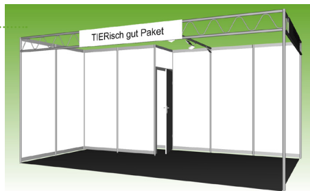
Abbildungen: Musterzeichnung Eckstand 15 m 2